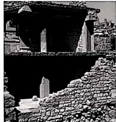
Restos del ala sur del Palacio de Knossos

Por un largo corredor se llega a la sala del trono con un majestuoso sillal de piedra colocado en lugar destacado y bancos adosados a las paredes, destinados a dar comodidad a los más altos dignatarios de la corte o consejo real. Posee también una pintura mural deslumbrante.