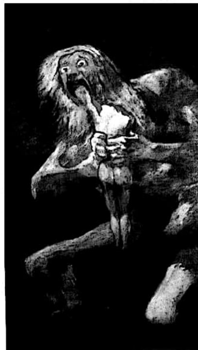
Saturno Devorando a sus Hijos. Francisco Goya, 1821. Museo El Prado, Madrid