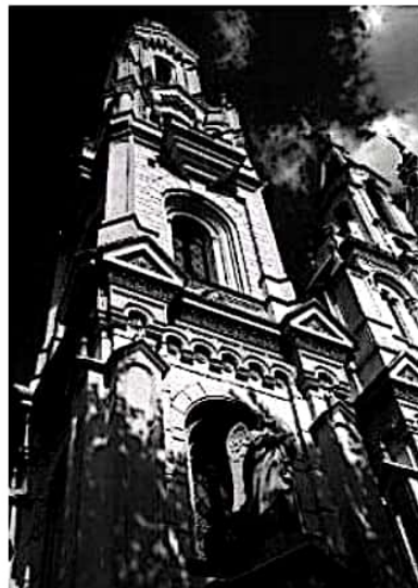
Iglesia de Santa Felicitas