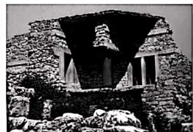
La casa del gran sacerdote en el Palacio de Knossos