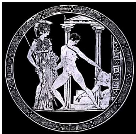
Fondo de copa griega con ilustración de Atenea, Teseo y el Minotauro. Museo Arqueológico Nacional. Madrid