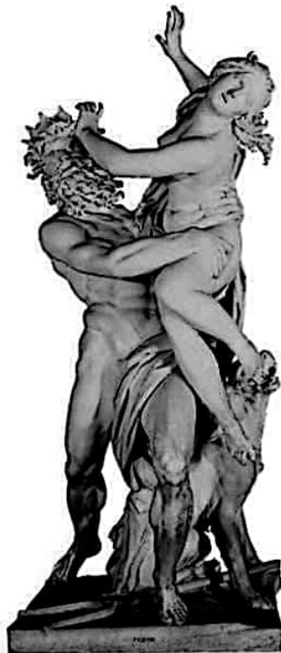
Plutón y Prosérpina. Gianlorenzo Bernini. Roma. Galería Borghese. Mármol