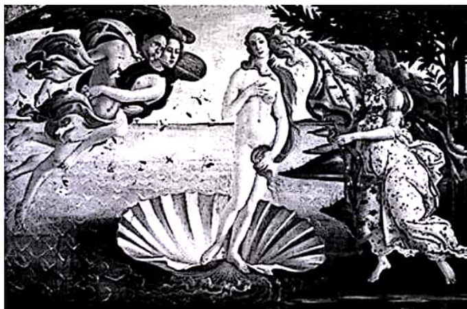
El nacimiento de Venus. Botticelli, 1486 Galería de los Uffizi, Florencia