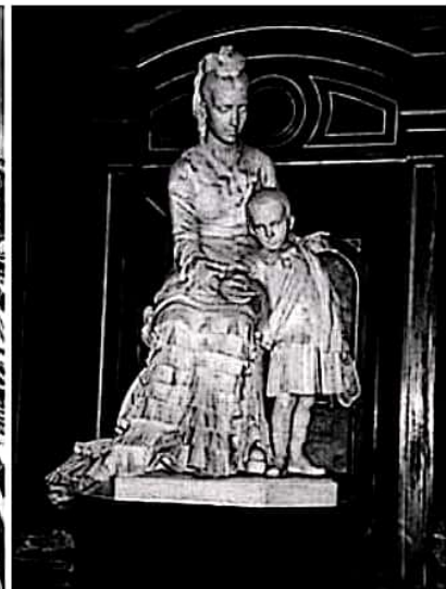
Estatua de Felicitas con su hijo Félix